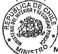
MARIO FERNÁNDEZ BAEZA MINISTRO DEL INTERIOR Y SEGURIDAD PÚBLICA

Sin otro particular, saluda atentamente a Ud.